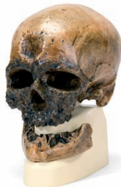
VP751/1 La Chapelle