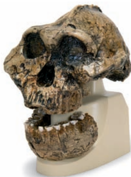
VP755/1 KNM-ER 406 Omo L. 7a-125