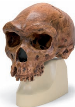
VP754/1 Broken Hill/Kabwe