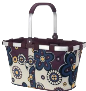
111.3037 Carrybag von Reisetel