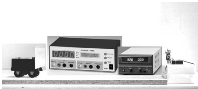
Abb. 1: Gesamtaufbau