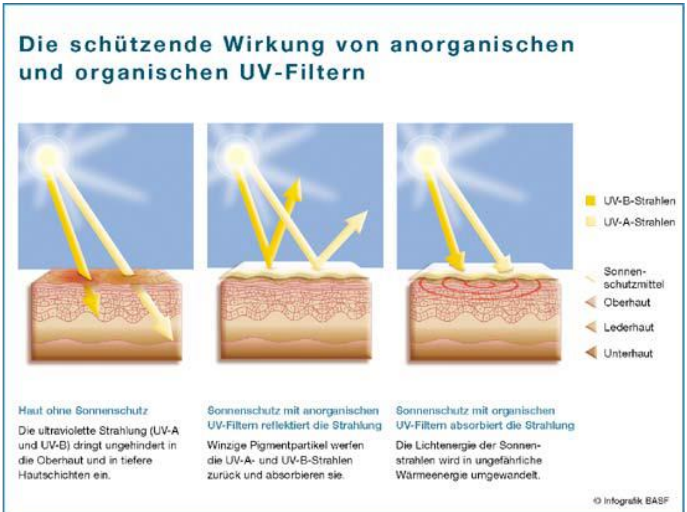
Abb.1: Wirkung physikalischer (Bild2) und chemischer (Bild3) UV-Filtersubstanzen