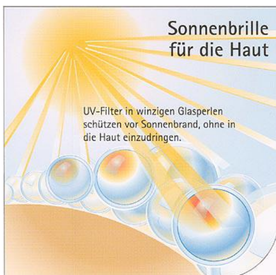
Abb. 2: Werbung für UV-Pearls der Firma Merck.