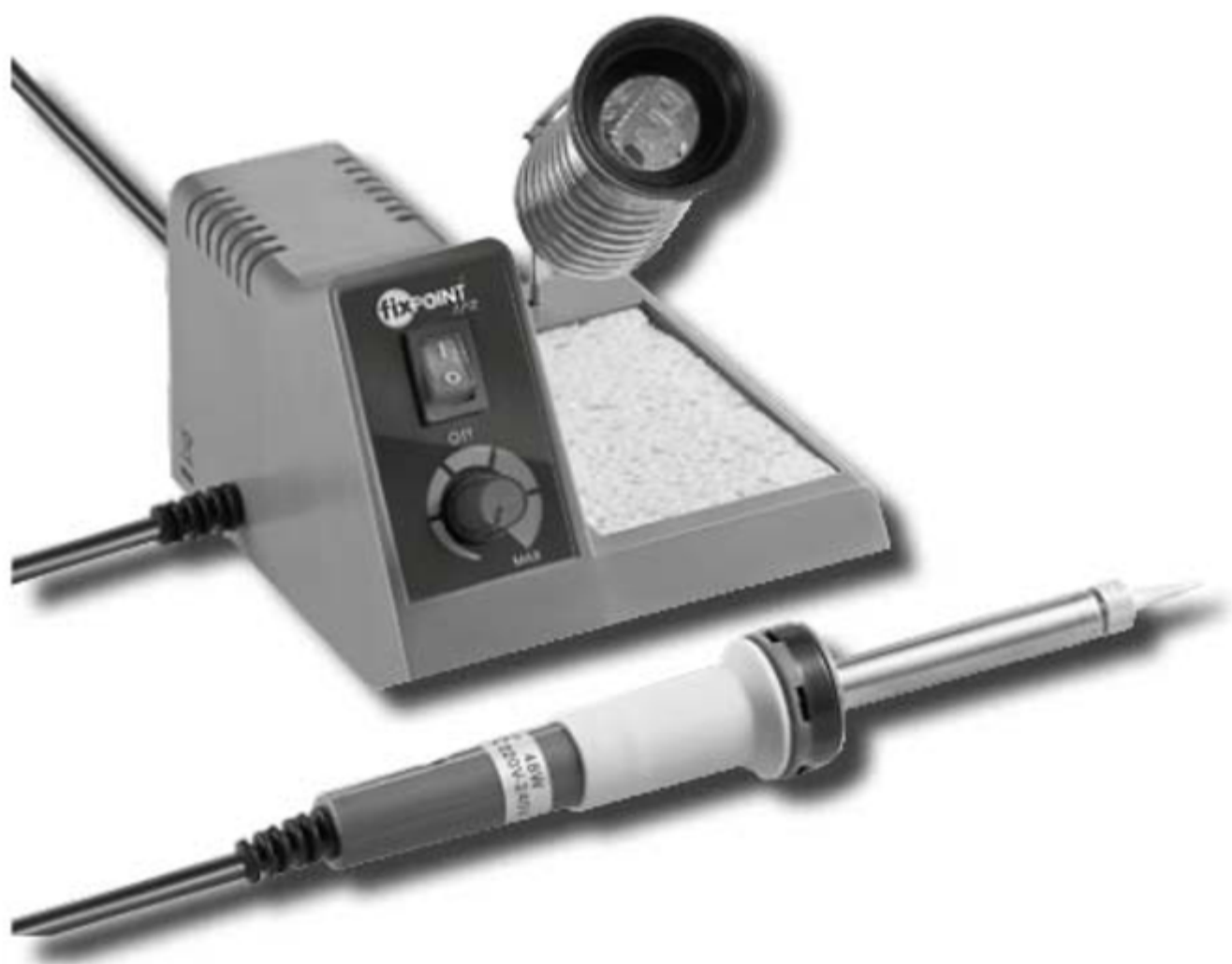
Lötstation | soldering station