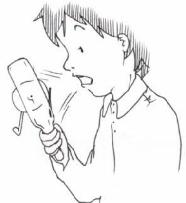
Fig.2 Humidifier l'appareil si l'air est sec