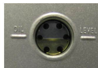
Le niveau d'huile observé ici est de 1/2

1 – Desserrez le bouchon noir de l'orifice d'évacuation. Utilisez un entonnoir pour verser l'huile. Pendant le remplissage, vérifiez le niveau: le volume optimal est obtenu lorsque le niveau se situe entre les deux lignes « min » et « max ». Refermez le bouchon après remplissage.