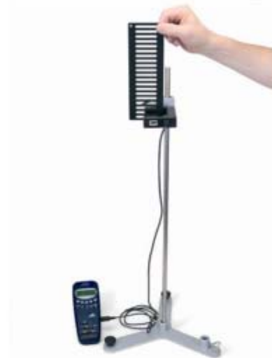
Fig.1 : Mesure de la chute libre