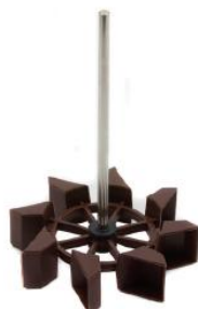
Modèle de turbine