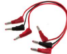
Cordon de mesure