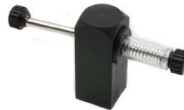
Catapulte à ressort