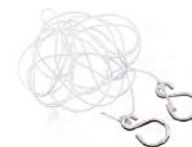
Cordon avec crochets