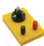
Support de lampe