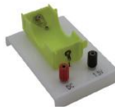
Support de pile